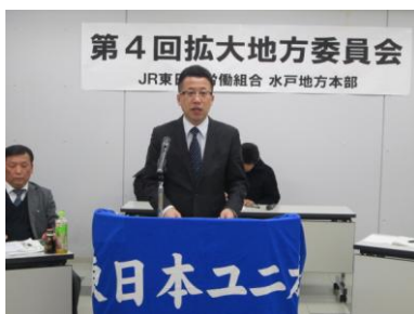
中央本部 生田書記長