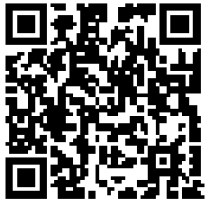
ホームページQRコード